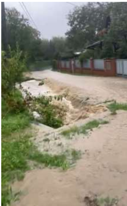
U č.p.77, 71